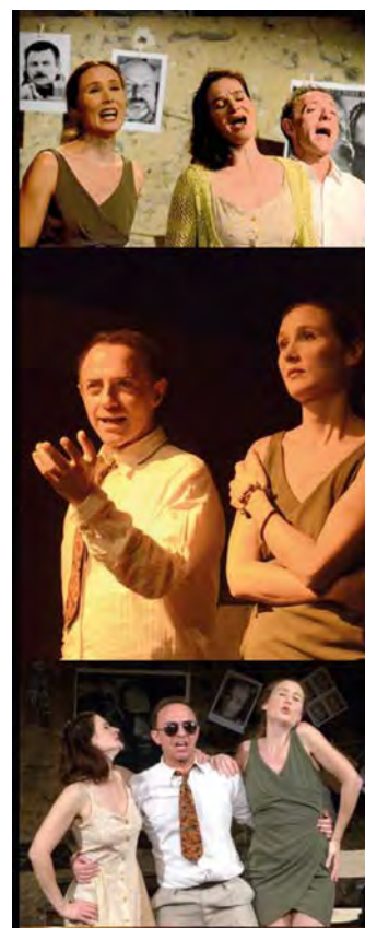
PASOLINI MUSICA, création 2017

La compagnie l'Arsenal d'apparitions, ses créations et ses actions de sensibilisation, sont soutenues par les collectivités locales et territoriales (cf. détail page 14), des institutions culturelles et de fidèles partenaires privés.