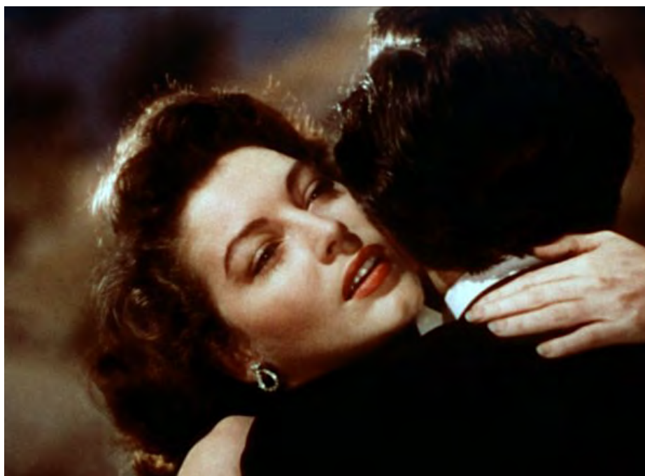
Ava Gardner dans Pandora (Pandora and the Flying Dutchman) , film d'Albert Lewin (1951).

La création de ce spectacle accompagne une réflexion sur des sujets dont l'actualité n'est plus à prouver : les féminismes, le patriarcat, l'égalité sociale, la procréation sous toutes ses formes, etc. C'est aussi une contribution au débat, qui vise à susciter la parole et inciter à la réflexion. Ainsi des temps de rencontre et de dialogue avec le public pourront être organisés en amont et/ou en aval de la représentation - dans les lieux de diffusion, les établissements scolaires, les structures sociales, les lieux associatifs citoyens.