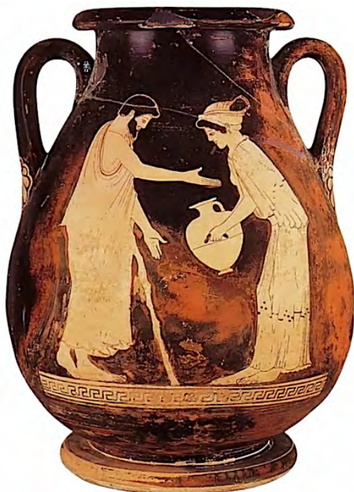
Vase grec, vers - 480.

Pandora rappelle que dans sa jarre elle a aussi apporté l'espérance, « qui traversera les mondes ». Le Chœur réfute cet argument, destiné selon lui à « endormir » les hommes. Épiméthée comprend alors que Pandora n'est pas coupable, qu'elle n'a fait qu'obéir aux dieux. Il réaffirme son amour pour elle, qui reste plus fort que tout.