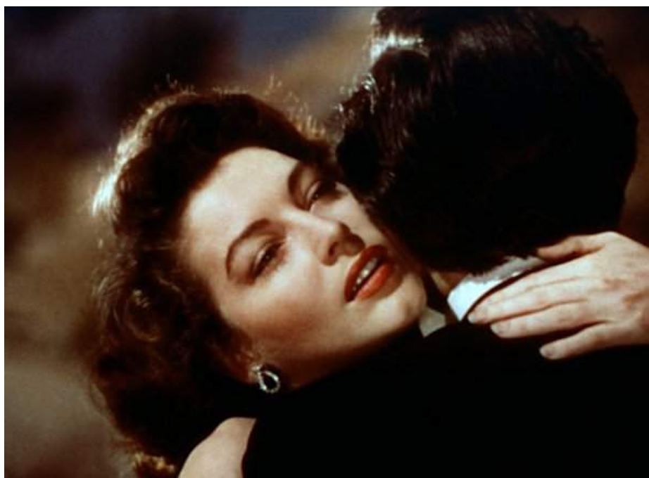
Ava Gardner dans Pandora (Pandora and the Flying Dutchman) , film d'Albert Lewin (1951).

La création de ce spectacle accompagne une réflexion sur des sujets dont l'actualité n'est plus à prouver : les féminismes, le patriarcat, l'égalité sociale, la procréation sous toutes ses formes, etc. C'est aussi une contribution au débat, qui vise à susciter la parole et inciter à la réflexion. Ainsi des temps de rencontre et de dialogue avec le public pourront être organisés en amont et/ou en aval de la représentation - dans les lieux de diffusion, les établissements scolaires, les structures sociales, les lieux associatifs citoyens.