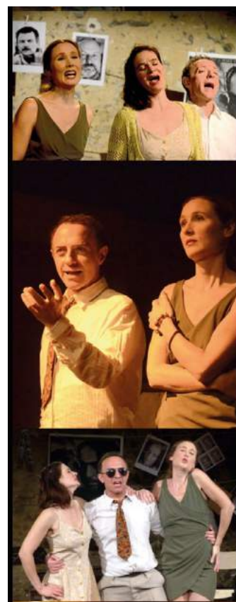
PASOLINI MUSICA, création 2017

En 2021 l'Arsenal d'apparitions assurera la direction artistique d'un nouveau tiers-lieu culturel, L'Étoile , dans un bâtiment réhabilité et mis à disposition par la Ville d'Alençon – engagement fort de la collectivité qui soutient depuis des années les créations, les actions de sensibilisation et de médiation de la compagnie, qui s'y installe ce printemps en résidence permanente. Elle y proposera une saison autour de la voix et du théâtre chanté, mais aussi une ouverture aux ensembles vocaux et musicaux du territoire, et aux compagnies théâtrales ornaïses et normandes.