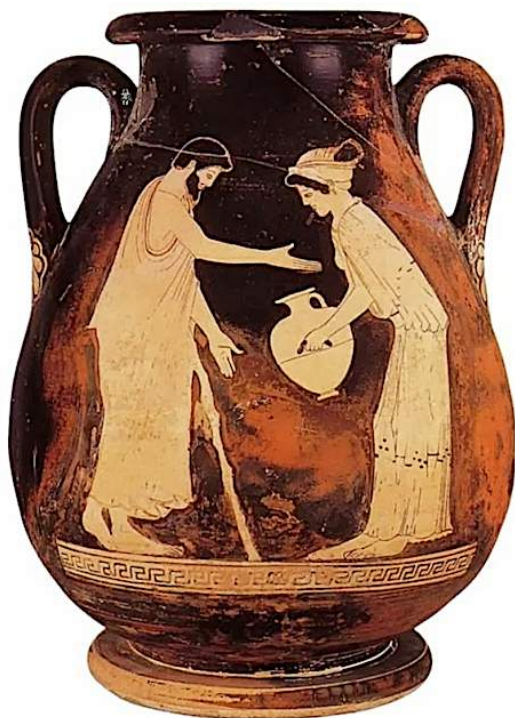
Vase grec, vers - 480.

Pandora rappelle que dans sa jarre elle a aussi apporté l'espérance, « qui traversera les mondes ». Le Chœur réfute cet argument, destiné selon lui à « endormir » les hommes. Épiméthée comprend alors que Pandora n'est pas coupable, qu'elle n'a fait qu'obéir aux dieux. Il réaffirme son amour pour elle, qui reste plus fort que tout.